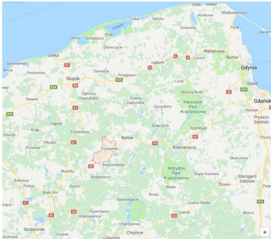
Mapa z położeniem gminy Tuchomie